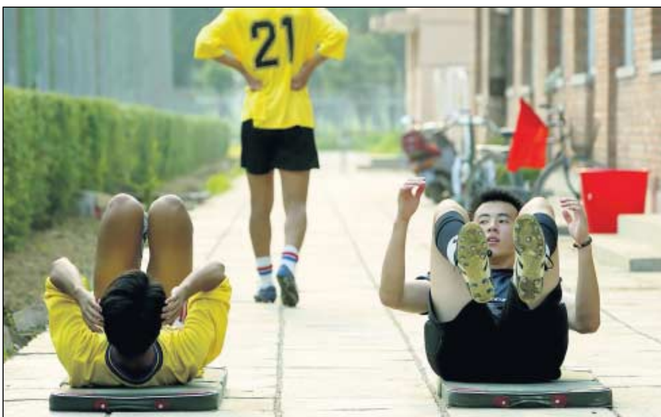
Alltag in einer Fussballschule in Peking: Je grösser die Bevölkerung, desto grösser die Chance auf ein Talent.